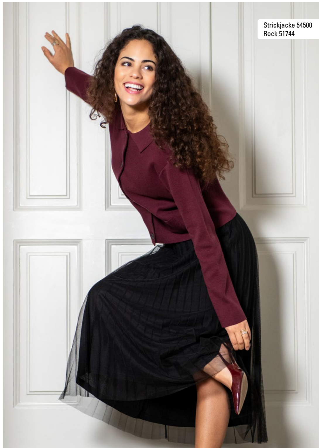
Strickjacke 54500 Rock 51744