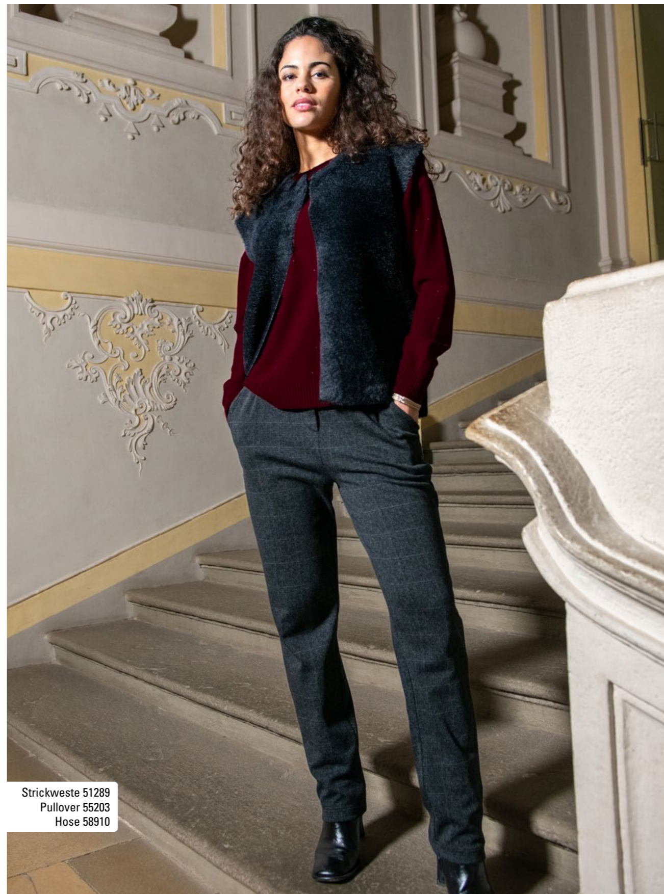
Strickweste 51289 Pullover 55203 Hose 58910