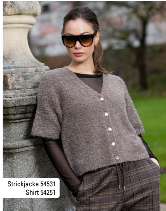
Strickjacke 54531 Shirt 54251