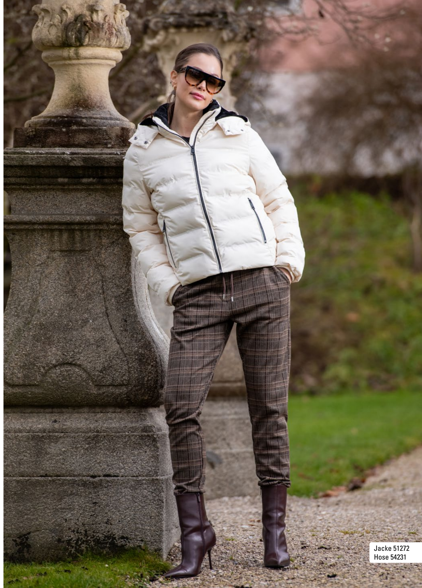
Jacke 51272 Hose 54231