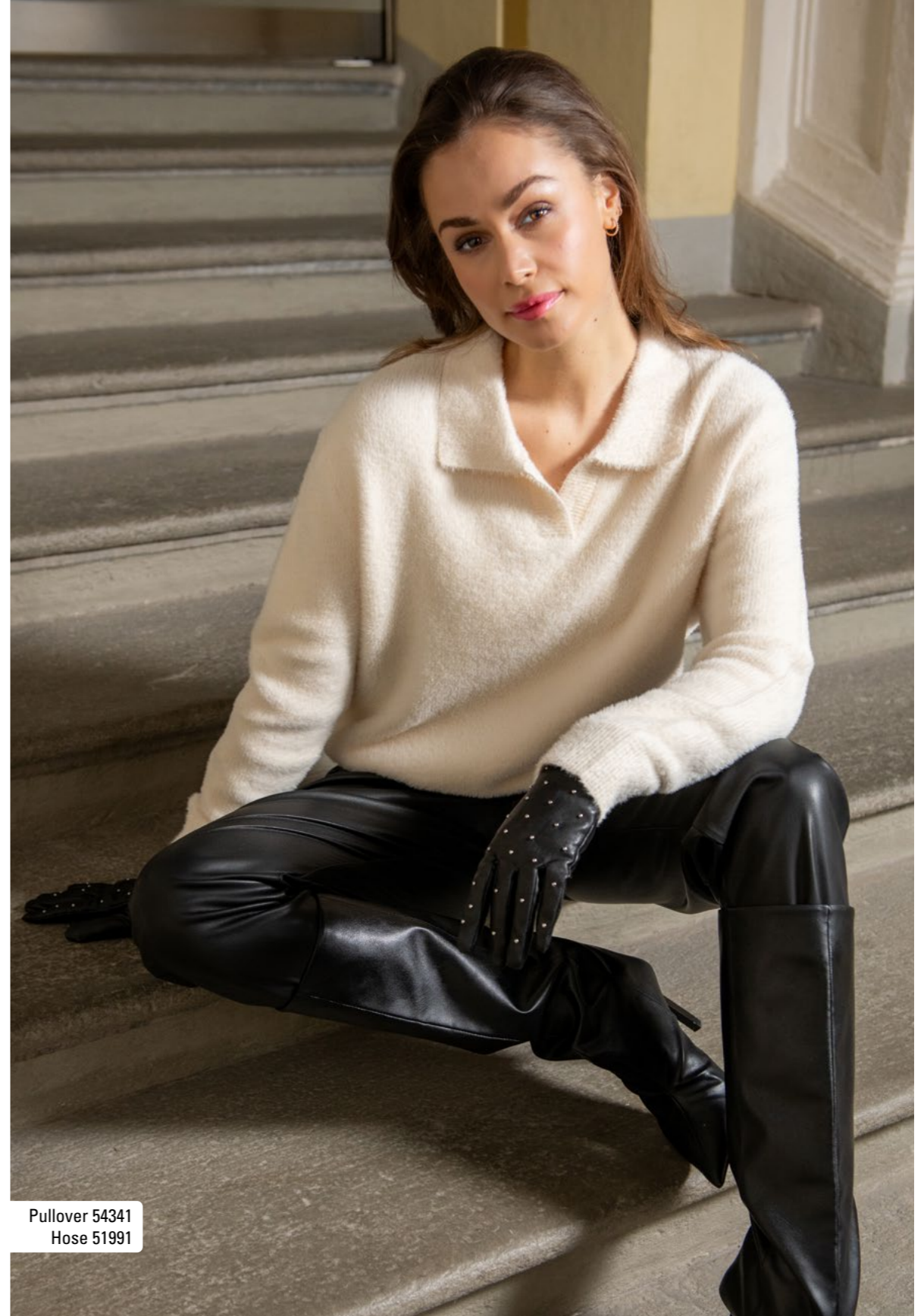
Pullover 54341 Hose 51991