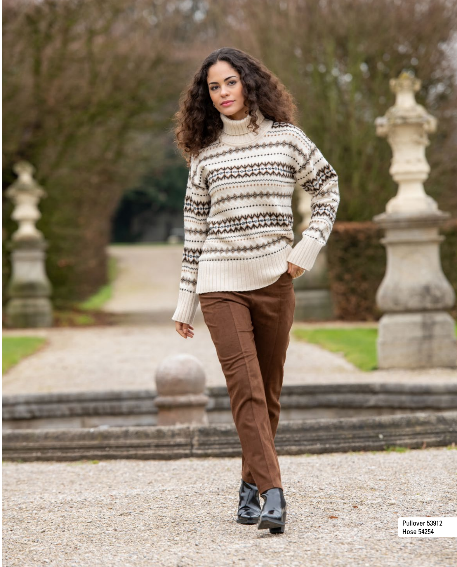
Pullover 53912 Hose 54254