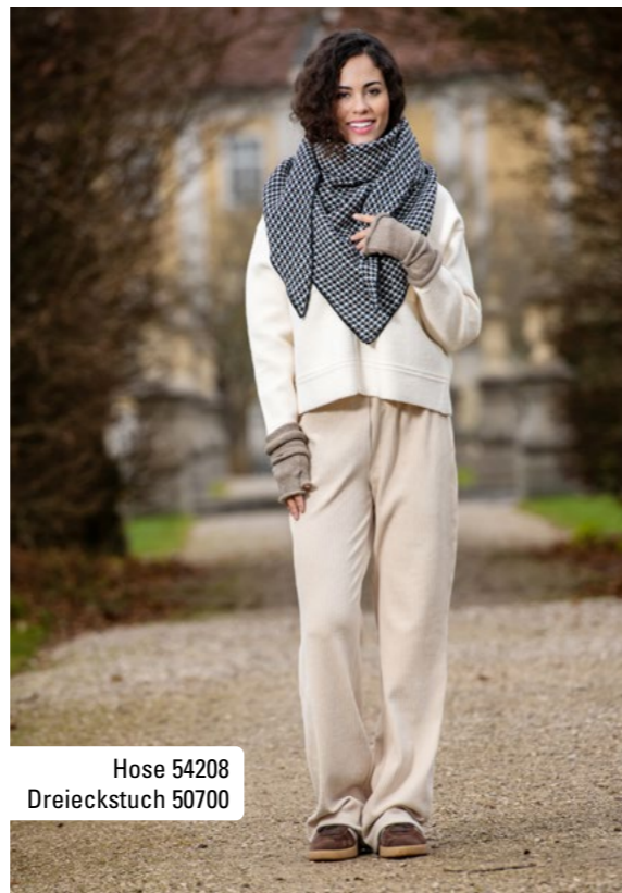
Hose 54208 Dreieckstuch 50700