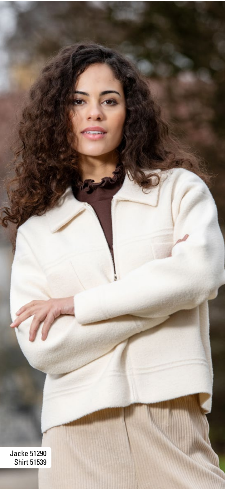
Jacke 51290 Shirt 51539

TITEL: Jacke 51278 Pullover 55202 Hose 58911